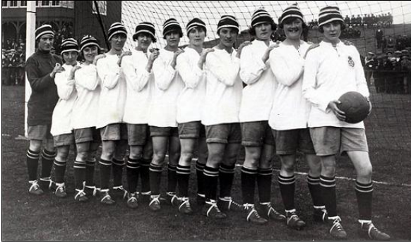
Le « Signore del Kerr » 1917

Dopo la seconda guerra mondiale nascono le prime squadre in Scozia e Francia